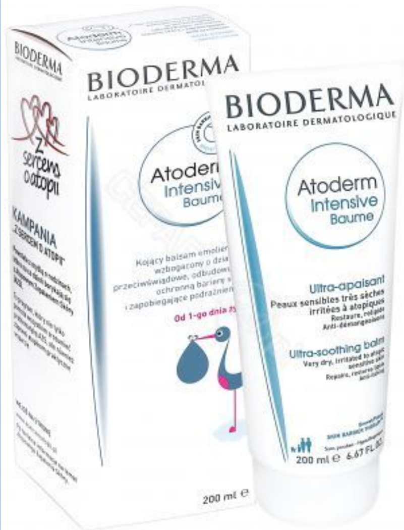
Bioderma Atoderm intensive kojący balsam emolientowy 200 ml SPRAWDŹ