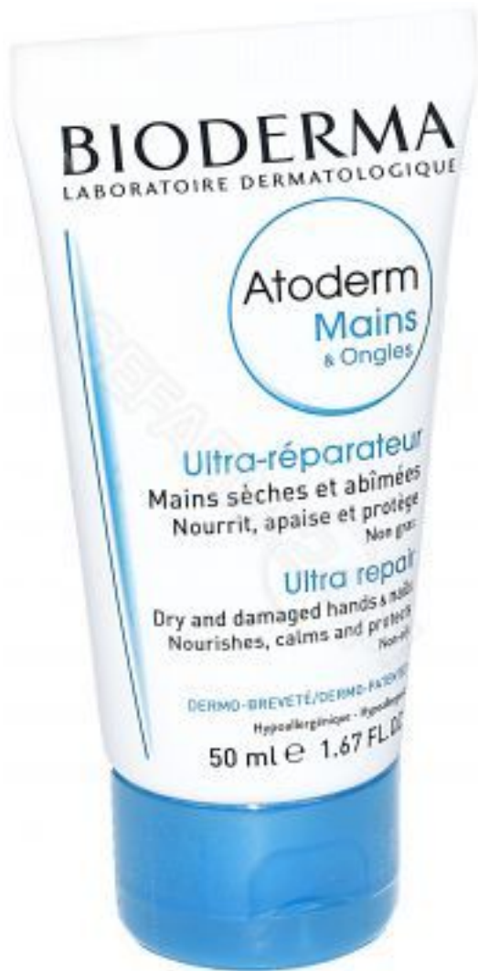
Bioderma Atoderm Mains & Ongles - odżywczy krem do rąk suchych i zniszczonych 50 ml SPRAWDŹ